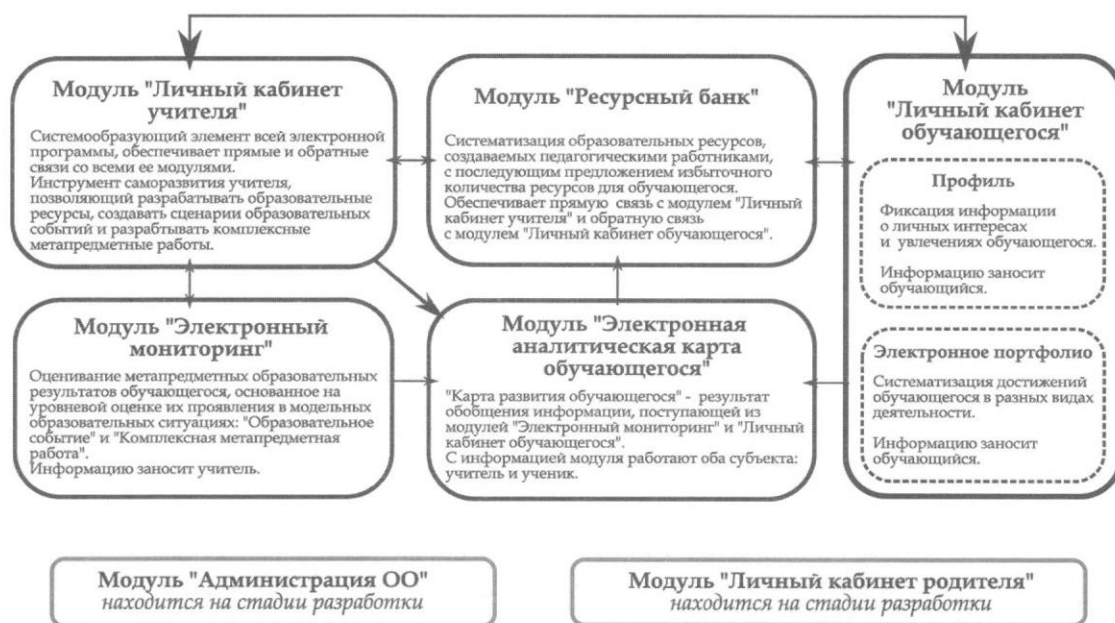
Рис.1. Схема электронной программы "Комплекс электронных модулей"*

Электронная программа «Комплекс электронных модулей» как интеграционный инновационный продукт включает в себя методики, процедуры, критерии оценки метапредметных компетентностей обучающихся, заданные в ФГОС, что представлено авторским коллективом гимназии в учебно-методическом пособии «Инновационный способ оценивания образовательных результатов обучающихся», изданном в 2016 году и дополненном в 2019 году (рис. 1).